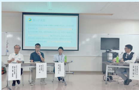
▲あたごプラザ協議会 舞校区ミライ会議の発表の様子

研修には2日間で市民・市職員が計60人以上参加し、これからの地域づくりを市民の皆さんと市職員が共に考える機会になりました。