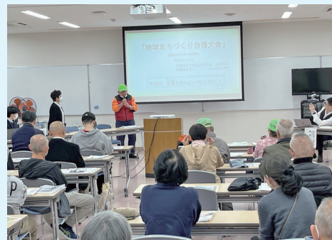
光陽台2丁目自治会の発表の様子▶

傍聴には、自治会や市民活動団体、社会福祉協議会、市民活動センター、校区（地区）福祉委員会、地域包括支援センターなど計50人以上参加し、新たなつながりづくりの場になりました。