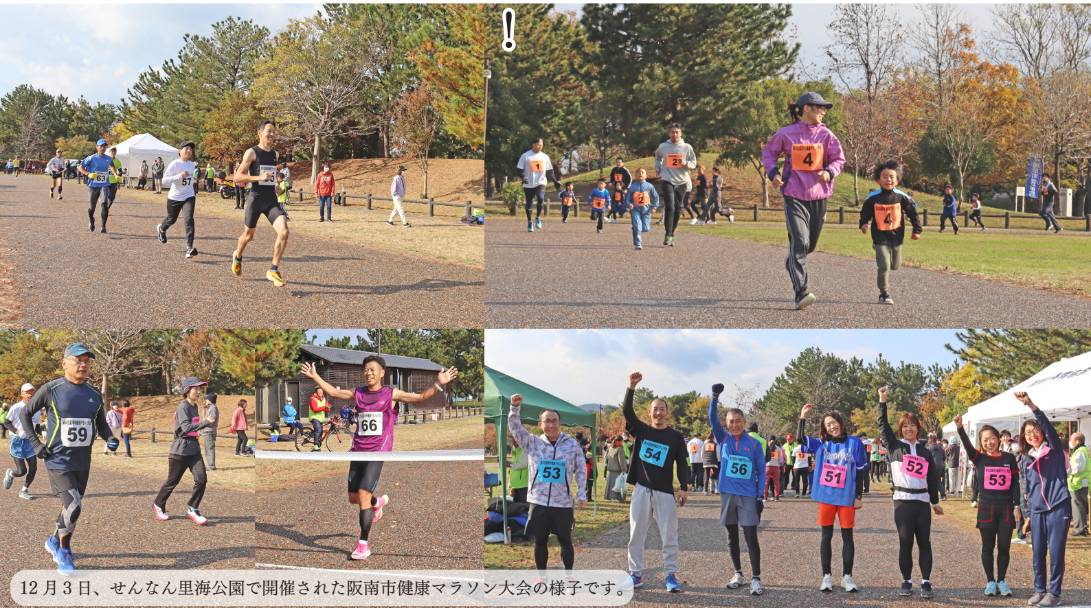
12月3日、せんなん里海公園で開催された阪南市健康マラソン大会の様子です。

掲載されている記事の内容が変更になる場合がありますので最新情報は本市ウェブサイトをご覧ください。