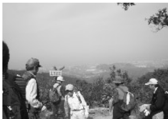
■ 俎石山クリーンハイキング