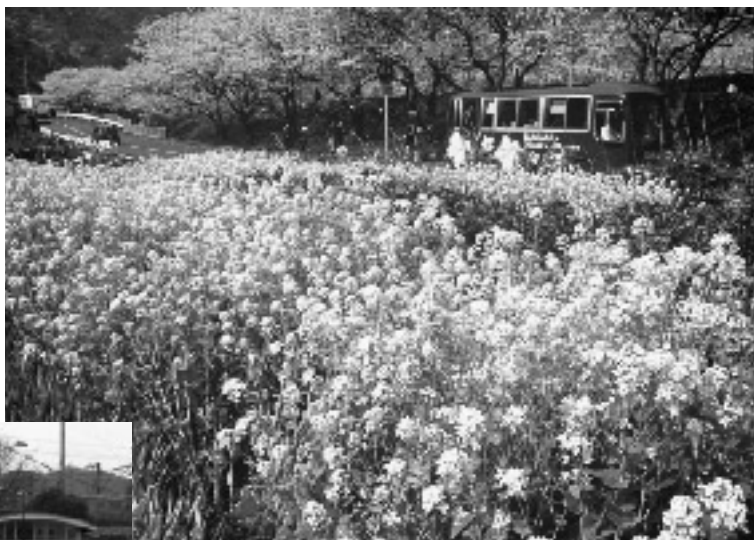
■コミュニティーバス