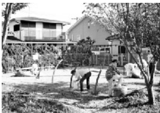
■ 阪南市アダプトプログラム