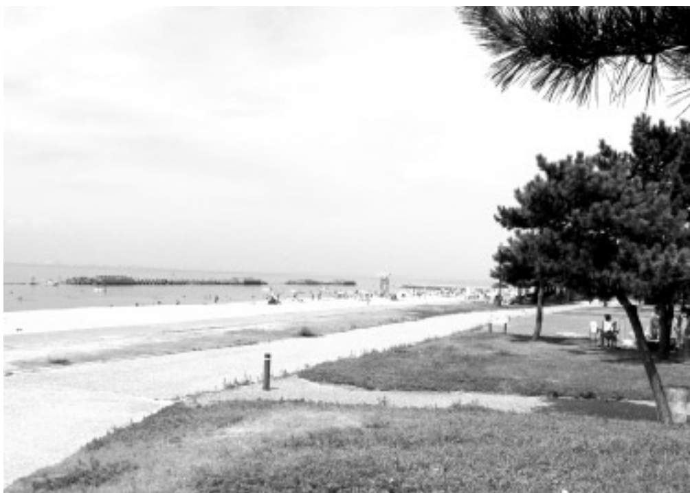
■ せんなん里海公園