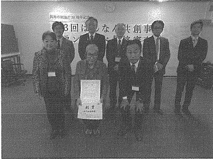
一般部門から3プランの応募がありました。