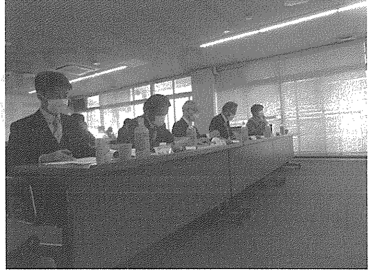
審査員の前でプレゼンテーション。 熱い想いを話っていました。