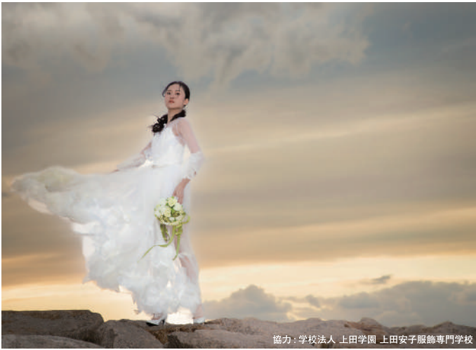
協力：学校法人 上田学園 上田安子服飾専門学校