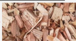
原料チップの作成