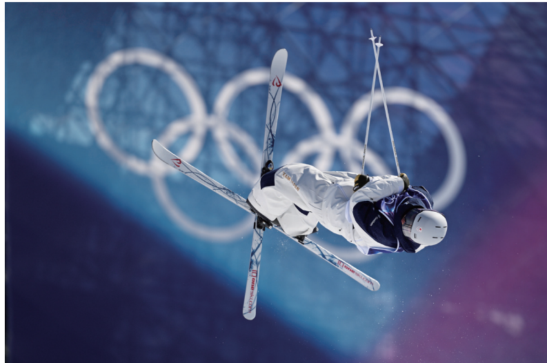
▲モーグル男子予選での豪心さん