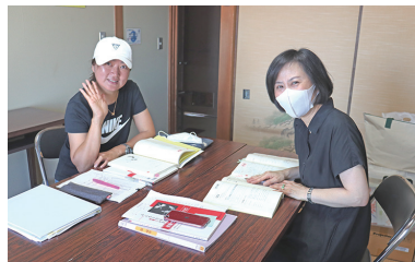
▲〈授業の様子〉授業は週1回90分。できる限りやさしい日本語を使って行います。