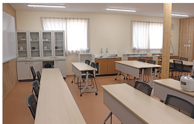
▲多目的室…会議室や調理などに利用できます。調理器具も使えます。