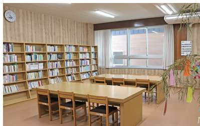
▲図書室…本の閲覧はもちろん、自習などにも利用できます。