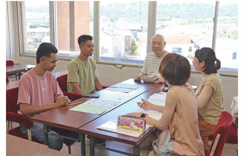
▲〈面談の様子〉アットホームな雰囲気の中、これから教室に通う人の日本語習熟度を確認し、担当者や使用する教材を決めます。