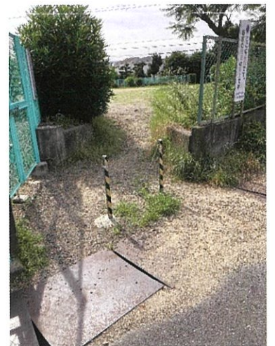
自然田タコ公園に子ども 飛び出し防止ポール設置