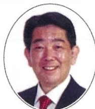
二神 勝 ふたがみ かつ