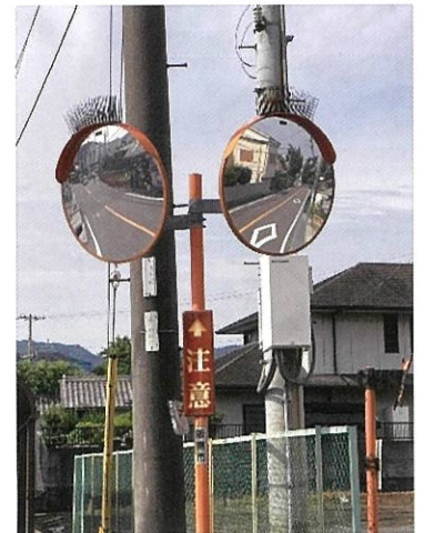
自然田724付近 カーブミラーに小鳥よけを