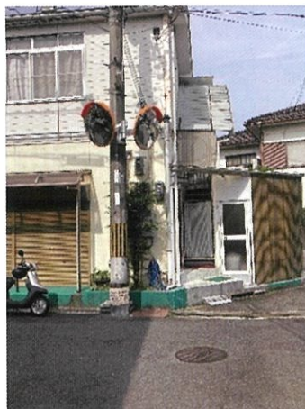
自然田786付近 カーブミラー新設