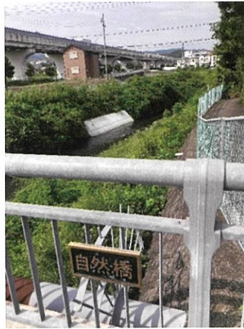
自然橋を流れる ウド川の補修工事