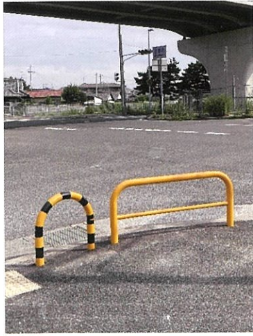
自然橋交差点に U型バリカー(防護柵)