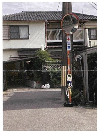
下出522付近 カーブミラー新設