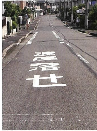
さつき台 速度落せの路面標示