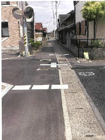
尾崎町3丁目交差点に 事故防止の路面標示