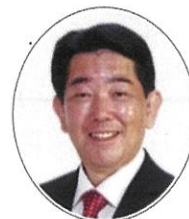
二神 勝 ふたがみ かつ