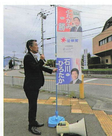
【阪南市立総合体育館前】