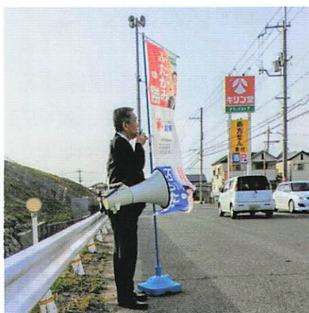
【キリン堂(阪南石田店)前】