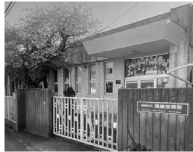
▲売却が決定された旧尾崎保育所

答 未利用財産等の利活用については、財源の積極的な確保の観点から、プラン改訂版の中で「今後の公共施設等の取り扱い方針」を掲げ、その方針に基づき、未利用地の処分や施設の貸付等を行っている。今後も一定期間事業が見込まれない施設は、民間活力を前提とした利活用や、市民協働による活力を検討するとともに、利用計画のない施設は、速やかな処分に向け手続きを進め、自主財源の確保に取り組む。