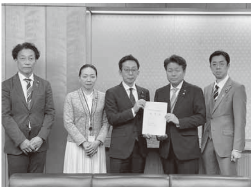
▲総務省への特交要望の様子

本市は、里山・里海が出会う「ちょうど良い田舎」として、豊かな自然に囲まれているものの、市域における企業数が少ないため、法人関連の税収が非常に乏しい状況です。 本市の行財政運営は、地方交付税に依存していると非常に大きく、住民自治を展望する公民協働のまちづくりを着実に推進していくため、貴重な一般財源である特別地方交付税に係る要望活動を実施しました。