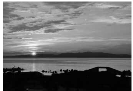
▲せんなん里海公園からの夕陽