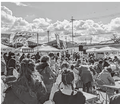
▲1月27日開催「はんなんSDGs万博」の様子

本年1月27日に「はんなんSDGs万博」を開催したが、今年の秋に再度市役所周辺において同万博を行いたいと考えている。