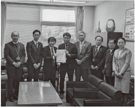
▲国土交通省への複線化要望の様子

第二阪和国道は、大阪と和歌山を結ぶ高規格道路であり、地域の社会・経済活動の発展、観光施策の推進のために不可欠な道路であります。 今後、南海トラフ地震をはじめとした自然災害や大きな事故が起こることも想定され、通行止め等により機能を失う恐れも考えられることから、地域住民の安全で安心な暮らしを確保する「いのちの道」として、4車線全線開通の実現に向けた整備促進の要望活動を和歌山市・岬町と共に実施しました。