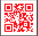
阪南市卓球 ブログ

反射神経、俊敏性が養われ集中力、 判断力向上が期待出来ます。 子供から年配の方まで体の動く 限り楽しめるスポーツです。 全国大会出場を目指し活動して います。 見学希望の方はお電話下さい。