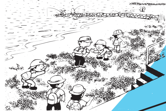
海浜植物 ハマボウフウ、ハマヒルガオなどの海浜植物が群生しており、観察できます。