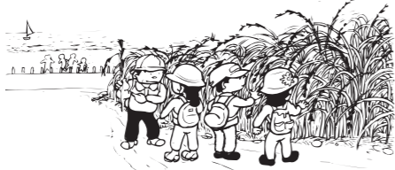
ヒトモトスキ 名前はスキでも、スキではありません。見落とさないでね。

浜街道は、孝子越街道ともいい、現在の泉佐野市鶴原付近で紀州街道から分かれ、海岸沿いに佐野の町場から田尻、泉南、阪南市尾崎・鳥取・箱作、岬町淡輪を通り、孝子峠を越えて紀州に通じていた街道です。