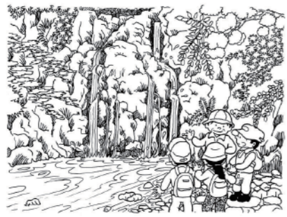
遊来の滝 田山稲荷のすぐそばで、思いがけないところに大きな滝があります。