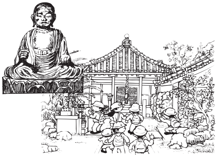
宗福寺 温和な表情を持ち、洗練された端正なお地藏様が安置されています。