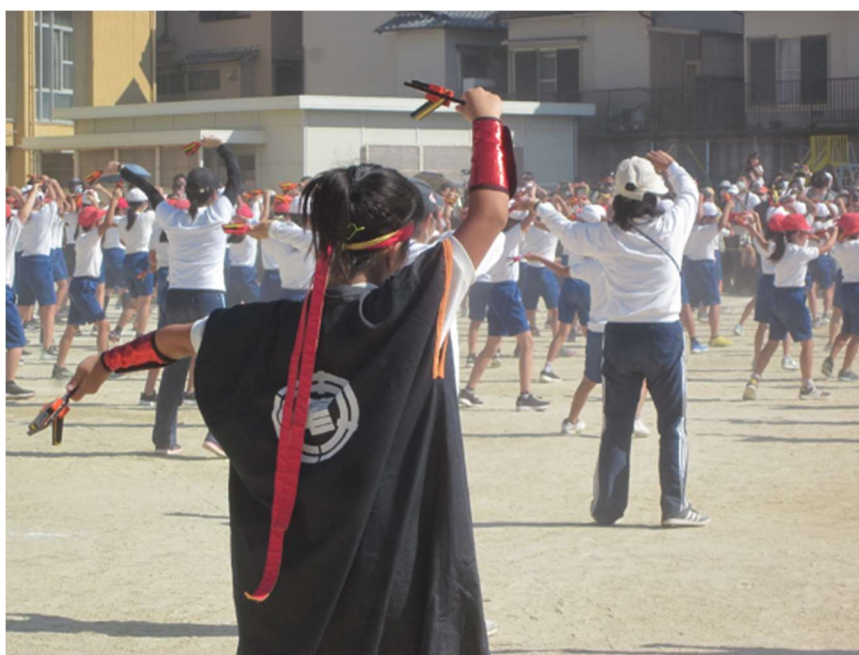
小学校 運動会(鳴子踊り)