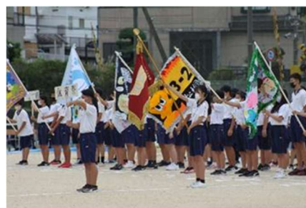
中学校 体育祭(開会式)