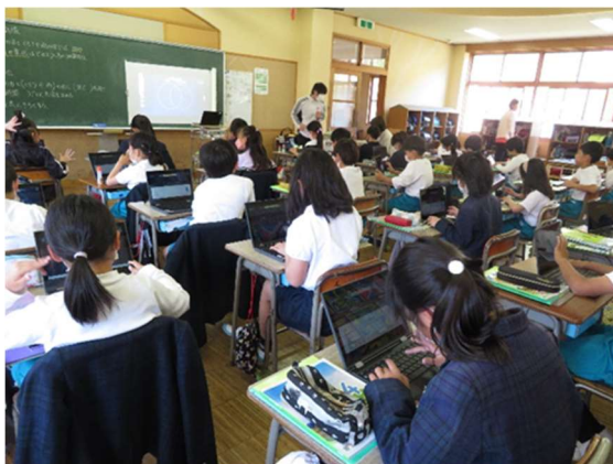
小学校 1人1台端末による学習活動