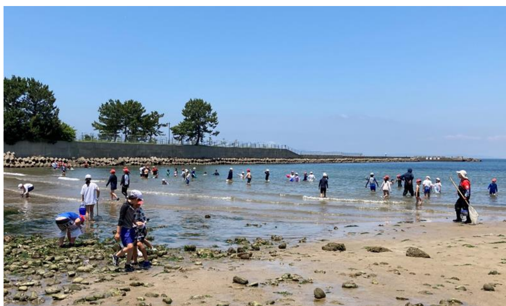
小学校 海洋教育における体験活動(生きもの探し)