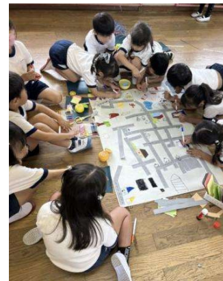
市立幼稚園 製作活動

現代は、先行きが不透明で将来の予測が困難な時代であると言われています。本市では、市民一人ひとりが自分の良さや可能性を見出すとともに、他者を価値ある存在として尊重し、多様な人々と協働しながら様々な社会課題に挑戦し、豊かな人生を切り拓き、未来社会に向かい、持続可能な今後の社会のつくり手となることが望まれています。