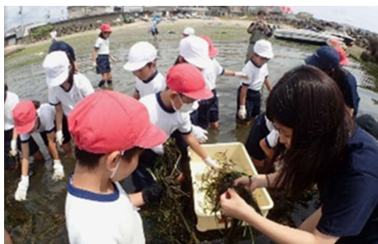
小学校 海洋教育における体験活動(アマモの栽培)