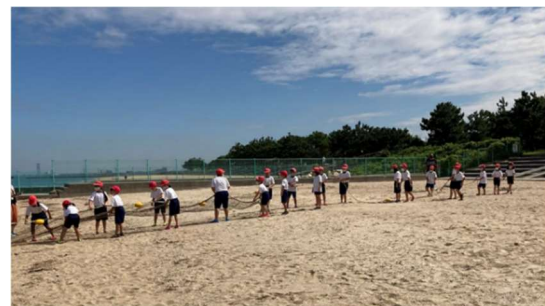
小学校 海洋教育における体験活動（地引網）