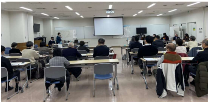
中央公民館 地域のつくり手育成講座