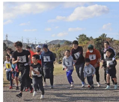
堺南市健康マラソン大会