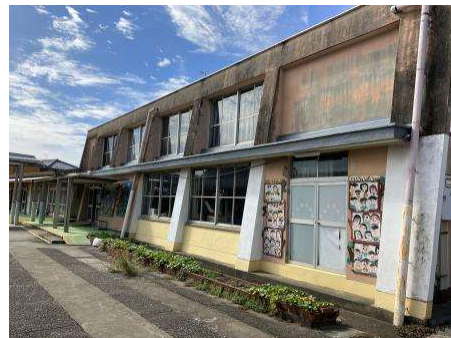
教育支援センター「シンパティア」