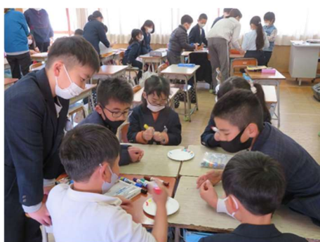
小学校 異年齢集団による学び合い

今後、阪南市は、「誰一人取り残さず 誰もが輝くことができる 協働・共創社会のひと・まちづくり」をこの教育大綱の基本理念として、社会が大きく変動する中で、将来、大人になる子どもたちの主体形成はもとより、全ての市民、団体、地域が豊かな地域社会を形成できるよう、学校教育、家庭教育、社会教育を通して、市と教育委員会が強く連携し、阪南市の宝である子どもたち一人ひとりの豊かな未来のため、また、まちづくりの主役である市民の皆さん一人ひとりの幸福のため、必要な教育施策を着実に実行してまいります。