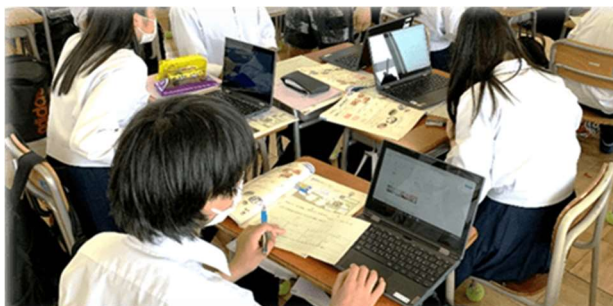
中学校 1人1台端末による学習活動