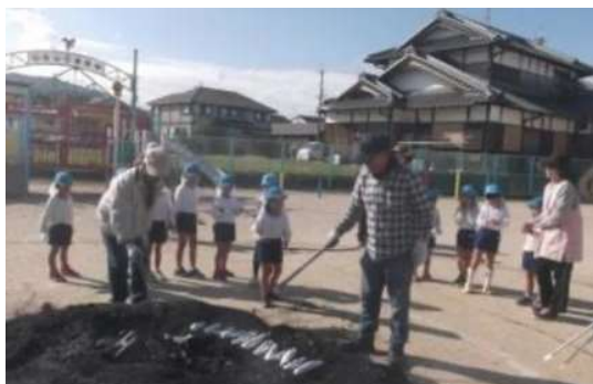
市立保育所 地域交流行事(焼き芋)