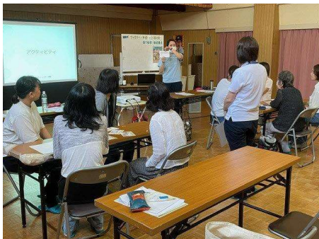
ファミリー・サポート・センター 協力会員養成講座