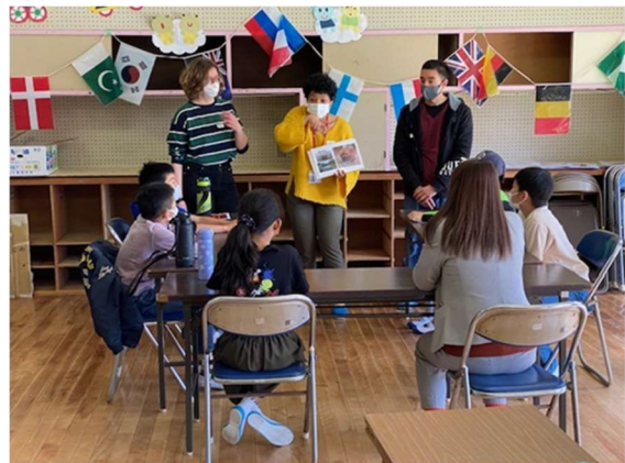
小学校 ALT(外国語指導助手)配置事業