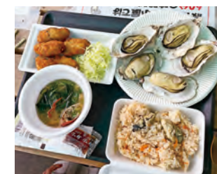
波有手牡蠣小屋の様子