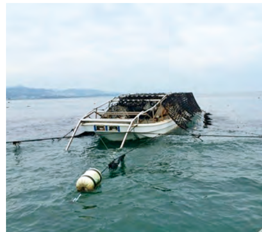
海苔の収穫の様子

令和4年から新たな試みとして、「すだて」体験を行う予定です。多くの人に来ていただき、海の生き物を網や手づかみでとって食べる体験を通し、大阪府で唯一自然の砂浜が残っている阪南市の海の魅力を感じてもらえればと思っています。