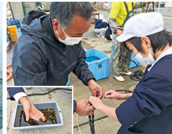
ワカメの種つけ体験をする小学生