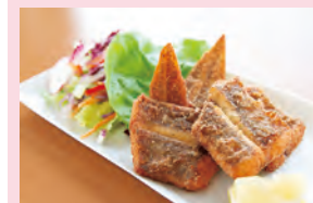
アカシタのからあげ