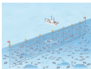
さ あみりょう 刺し網漁