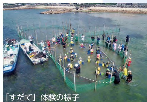
「すだて」体験の様子