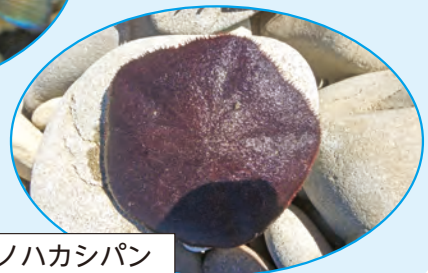
ハスノハカシパン