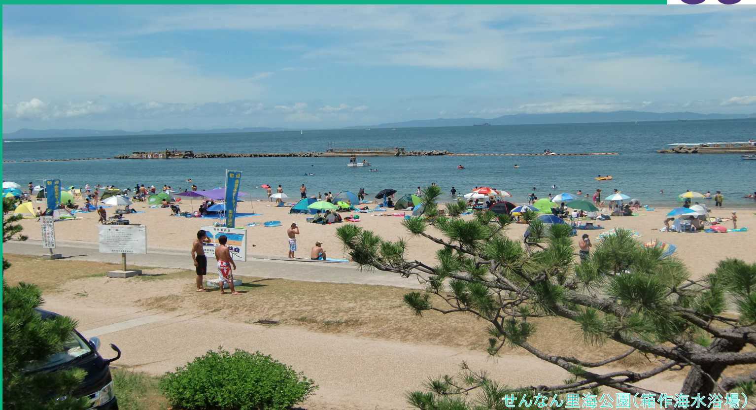
せんなん里海公園(箱作海水浴場)