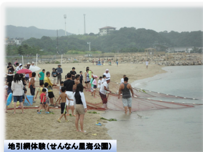
地引網体験(せんなん里海公園)

下水道の整備による水質改善と合わせ、水辺環境の整備により安心して暮らせる生活空間を形成する。