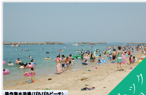
箱作海水浴場(びちびちビーチ)