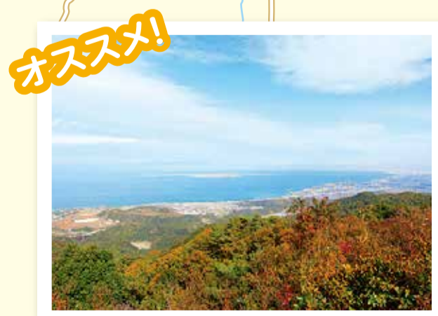
俎石山からの眺め