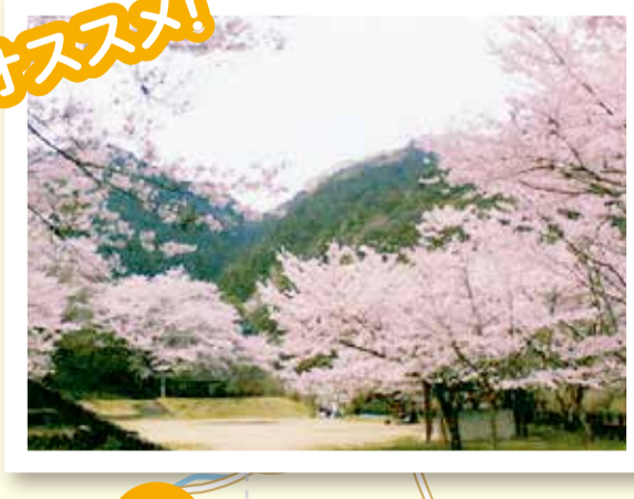
鳥取池ダム ⑪ 鳥取池緑地桜の園 ⑫ 鳥取池緑地桜の園