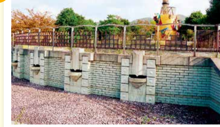
桃の木台4丁目付近