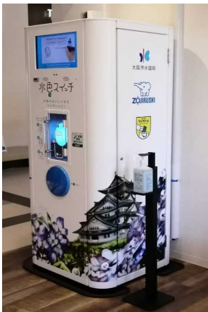
観光施設・商業施設へのマイボトルスポットの設置

府内の公共施設、多くの人々が利用する観光・集客施設におけるマイボトルスポットの設置を促進します。