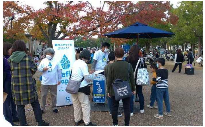
イベントにおけるマイボトルスポットの設置