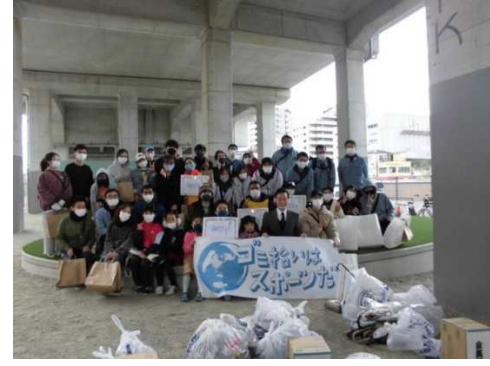
スポGOMI大会inいずみおおつ