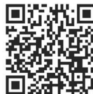
マイボトルパートナーズ QRコード