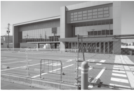
▲旧家電量販店建物