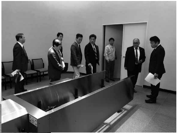
▲泉南阪南共立火葬場内覧会の様子