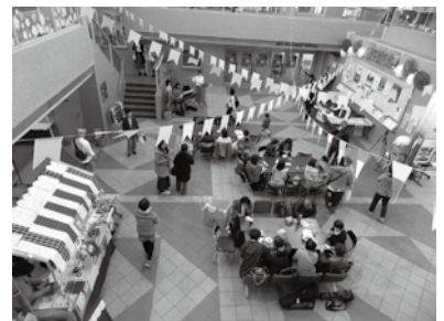
▲サラダフェスタの様子(サラダホール)

○G20、東京オリンピック・パラリンピック、阪南市のSDGs(エスディージーズ)の取り組みについて