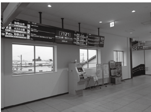
▲焼失から復旧した尾崎駅

エレベーターを設置するには、歩道の工事等も必要になるため、平成31年度中に周辺との調整を行う。