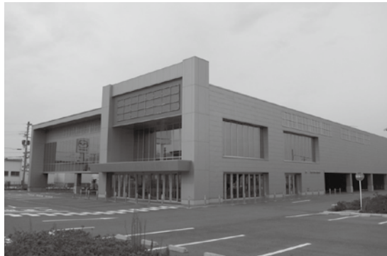
▲売却先が決まった旧家電量販店建物

固定資産税については、現状の建物のままであれば、約700万円であるが、1階のピロティ部分も施設として利用することであり、建物を再評価することにより、1・5倍程度の税収が期待できる。また、償却資産についても、数億円規模の設備投資を行うとのことであり、税収の増額が期待できるものである。