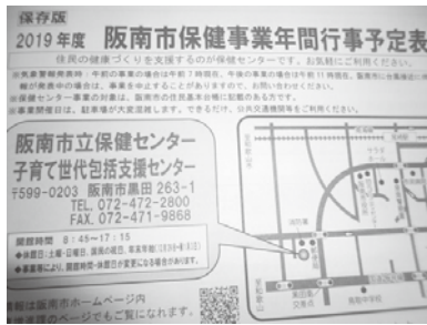
▲2019年度保健事業年間行事予定表

答 再構築案を具体化するにあたり、順序や段階を明確にし、その行程を示した詳細なロードマップの策定が必要だと認識している。そのため、施設規模の基礎となる第2期子ども・子育て支援事業計画策定のためのニーズ調査と3月15日に出る予定の子ども・子育て会議の最終答申の結果を踏まえ、平成35年度の完了に向け、第1ステージでの具体的な行程を示したロードマップを作成していく。