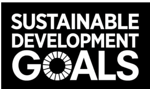
▲SDGs（エスディージーズ）ロゴマーク

課長 今年度は、1日7時間×35回×2人の実施であったが、来年度は1日8時間とし合計70時間増加する。