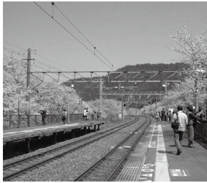
▲桜の季節の山中溪駅

課長 ハイキング客の休憩場所として、待合スペースを確保したい。また、地域のみなさんが考えた駅の活用方法を組み込んで、交流スペースや交流施設の整備を進めたい。