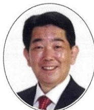
二神 勝 ふたがみ かつ