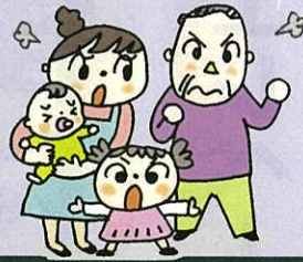
40歳代夫婦、子ども2人 所得400万円のモデルケース

根本的には国の責任ですが、標準保険料率をそのまま採用した平成31年度阪南市国保特別会計予算案には反対しました。