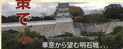
車窓から望む明石城... 本丸がないので櫓だけです。